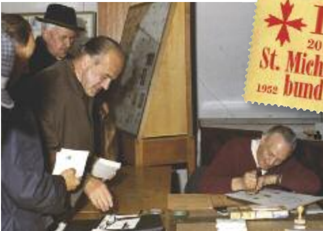
1972, WERBESCHAU anlässlich des 20-jährigen Bestandes des Michaelsbundes, Spendenaktionsmarke und Post-Ersttagsstempel