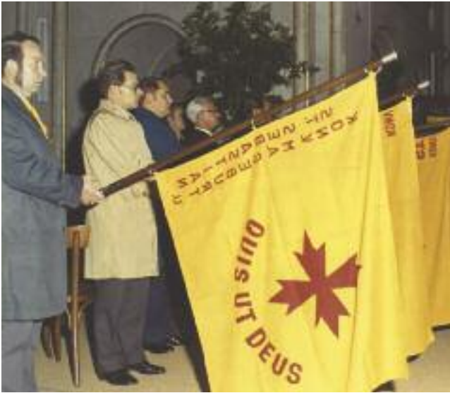
KONVENTFAHNEN 15. 10. 1972, 20 Jahre Michaelsbund Stiftungsfest in der Canisiuskirche