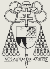
KARDINAL DR. CHRISTOPH SCHÖNBORN ERZBISCHOF VON WIEN